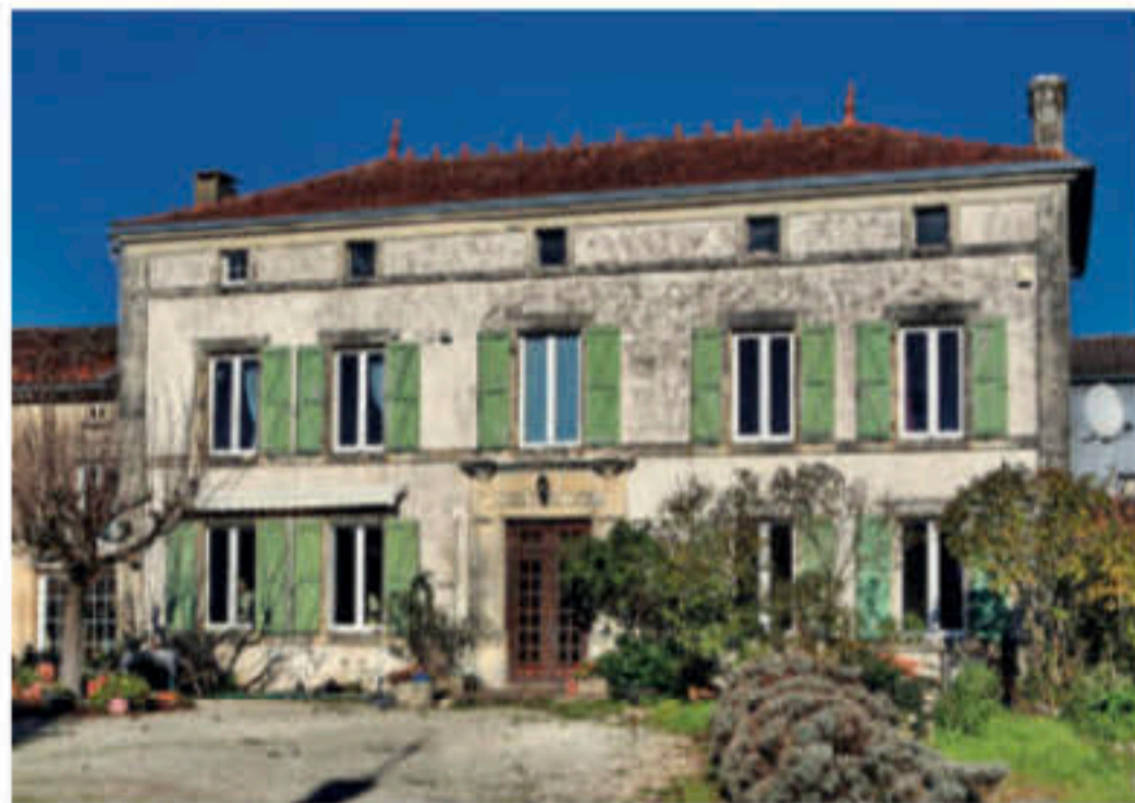
Bon nombre d'acquéreurs étrangers apprécient les propriétés un peu à l'écart

ATTRAIT. Malgré les contraintes générées par la pandémie, les étrangers continuent de plébisciter les zones rurales françaises, notamment celles du Sud-Ouest. Les secteurs de prédilection varient selon les nationalités. Les motivations sont un peu différentes de celles des acquéreurs français